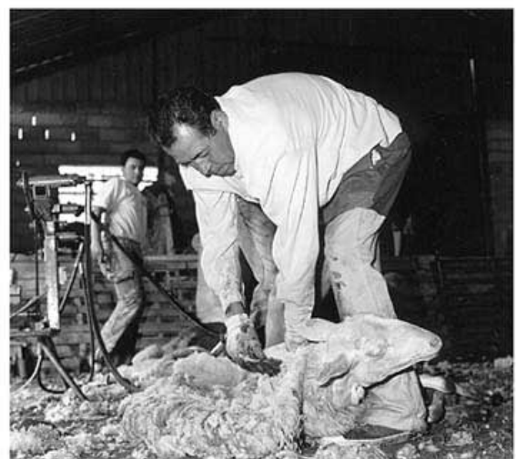
Ovejas en pleno proceso de su esquilado.