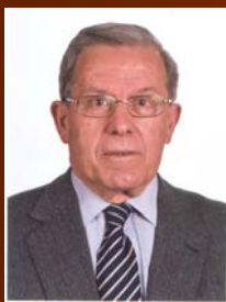
Manuel Alcázar Bermejo (Presidente de la CCLM)