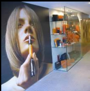
SUTEGA | PAPELERÍA BELLAS ARTES