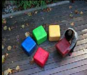
SUTEGA | ERGO SAÚDE