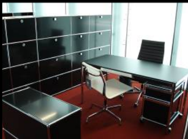
SUTEGA | OFICINA CONTRACT