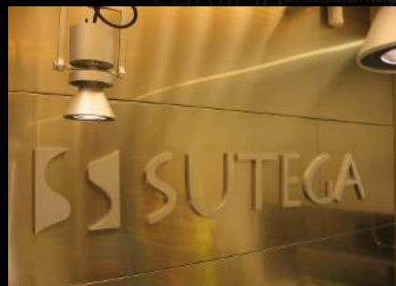
SUTEGA | OBRAS ILUMINACIÓN