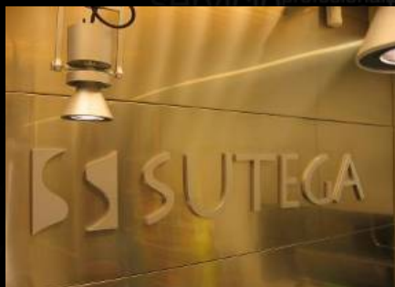
SUTEGA | OBRAS ILUMINACIÓN