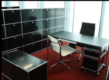
SUTEGA | OFICINA CONTRACT