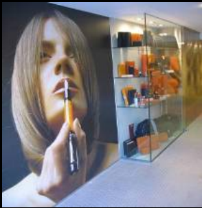
SUTEGA | PAPELERÍA BELLAS ARTES