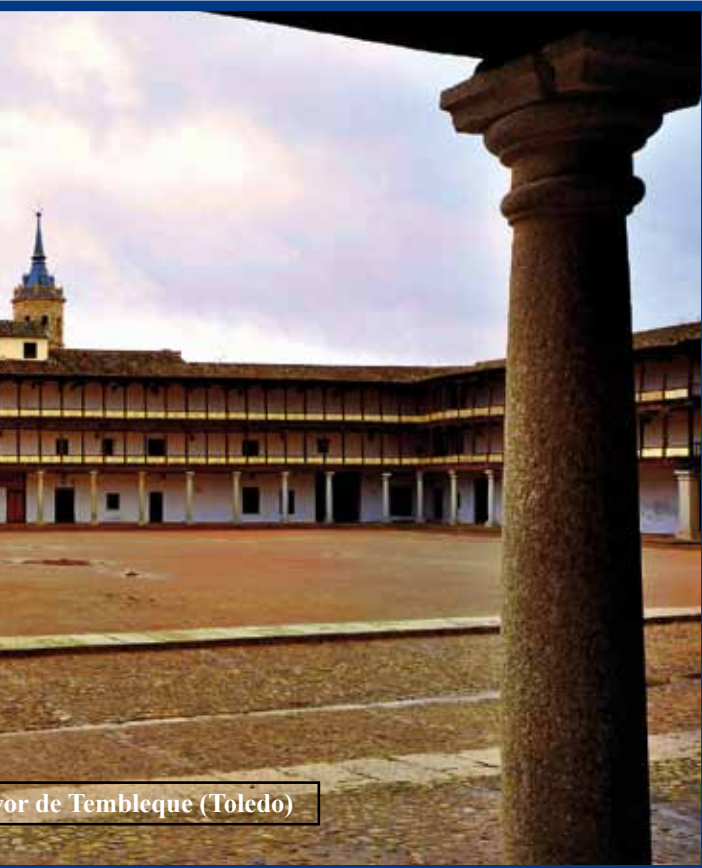
Plaza de Tembleque (Toledo)