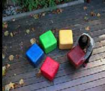
SUTEGA | ERGO SAÚDE