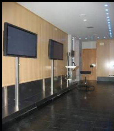
SUTEGA | AUDIOVISUALES TOPOGRAFÍA